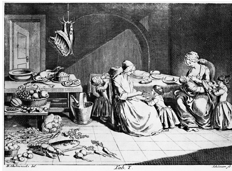
1. Bild aus Basedows „Elementarbuch“ gezeichnet von Daniel Chodowiecki

So beginnt das berühmte „Elementarbuch“ von Johann Basedow (in vielen Auflagen ab 1770 erschienen) mit dem Bild von essenden Kindern in einer Küche und geht dann über die Kleidung (und „Fehler, wodurch Kinder sie verderben“) weiter zu Kinderspielen und zu „Vergnügungen der Jugend und des männlichen Alters“.